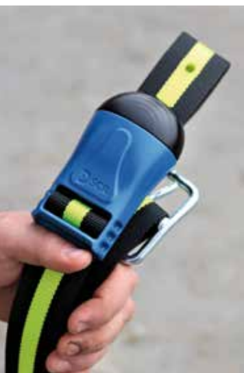
Il tag a collare del sistema SenseHub™

SenseHub™ è una soluzione hardware/software/cloud modulare che fornisce informazioni pratiche e utili sullo stato riproduttivo, di salute, nutrizionale e di benessere della singola bovina o di gruppo, come risultato di un algoritmo sofisticato e costantemente ottimizzato. Questa soluzione consente di scegliere fra collare ( Allflex Monitoring Neck Tag Flex ) e la marca auricolare ( Allflex Monitoring Ear Tag Flex V2 ) con molteplici applicazioni, opzioni di pagamento e dispositivi utenti. Tutti gli elementi del sistema sono modulari e possono essere ampliati o modificati con l'evolversi delle esigenze di allevamento.